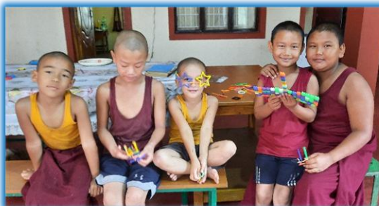
“Cuando educamos las mentes de nuestros jóvenes, no debemos olvidar educar también sus corazones.” SS Dalai Lama

Asociación Khetpa para los Niños del Himalaya C/ Miguel Servet, 16 28224 Pozuelo de Alarcón (Madrid) Correo Electrónico: khetpa@khetpa.org Web: www.khetpa.org NIF G86602893 Inscripciones: *Registro M. del Interior 601610 *Declaración Utilidad Pública Orden INT/2375/2015, de 28 de octubre Registro en India: Himalaya Laksham Cultural and Educational Charitable Society