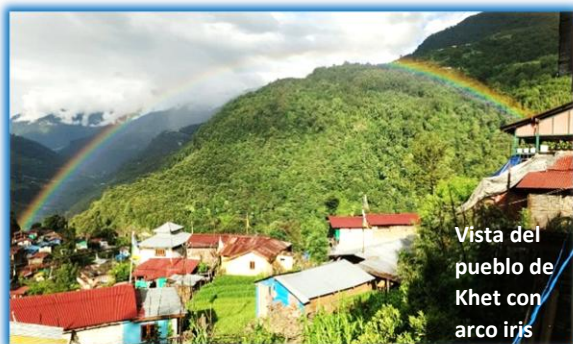
Vista del pueblo de Khet con arco iris

El objetivo de Asociación Khepta es crear un futuro mejor para los niños y jóvenes de esta región y sus familias, fomentando el desarrollo en la zona noreste de la India. Para realizar este triple objetivo Khetpa hace posible que los niños pueden estudiar hasta niveles superiores y formarse como profesionales para lograr un buen trabajo.