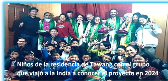
Niños de la residencia de Tawang con el grupo que viajó a la India a conocer el proyecto en 2024

En 2023 con la ayuda del gobierno de Arunachal Pradesh se inició la construcción de una residencia para los alumnos.