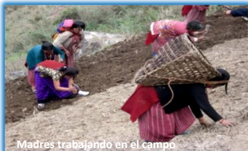
Madres trabajando en el campo

El proyecto de Asociación Khetpa nace en el año 1996 en la India para ayudar a niños del distrito de Tawang, en el estado de Arunachal Pradesh, en el Himalaya. Las aldeas que allí se encuentran tienen como principal fuente de ingresos la agricultura, pero como el terreno es montañoso no permite el uso de maquinaria. Todos los trabajos son manuales y las cosechas solo dan para la comida de la familia.