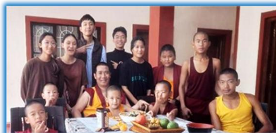
Alumnos de Secundaria y monjes de Sera Jey con Ven. Geshe Choeden, fundador

En 2013 el proyecto se registró como asociación en España con el nombre Asociación Khetpa para los Niños del Himalaya . En 2015 recibió la designación de Utilidad Pública del Ministerio del Interior. En el mismo año se registró en la India como Himalaya Lakhsam Cultural and Educational Charitable Society .